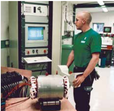
Diagnostik och kontroll