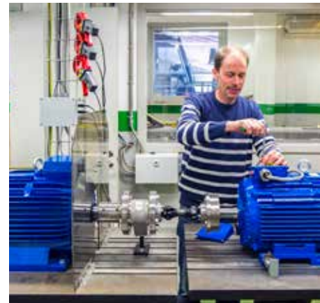
Testkörning i eget lab