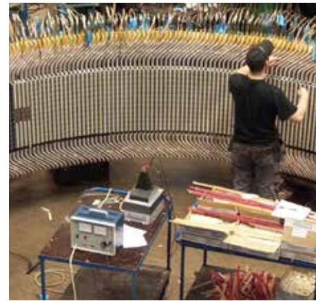
Uppgradering av generatorer