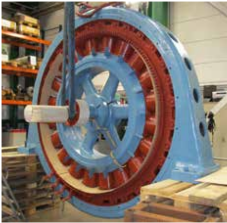
Omlindning och renovering av generatorer i alla storlekar

Vår serviceverkstad är alltid öppen för dig som kund dygnet runt, året om. Goda verkstadsresurser tillsammans med vår långa och breda erfarenhet av generatorer utgör grunden för ett långsiktigt samarbete med dig som servicekund.