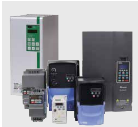
Frekvensomriktare och återmatningsenheter